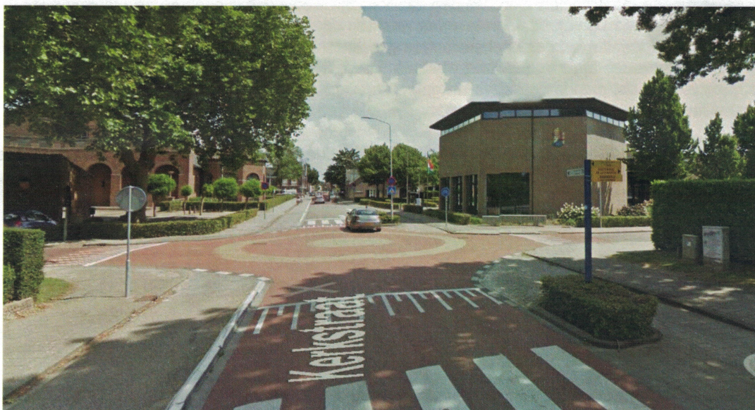
Voorbeeld beoogde inrichting kruispunten Paterstraat (voorbeeld van locatie Kerkstraat)

In het ontwerp van de Paterstraat worden snelheidsremmende maatregelen opgenomen om de rijsnelheid van het verkeer terug te dringen. Op de kruispunten met alle zijwegen worden plateaus met een visuele punaise geprojecteerd, zoals deze ook op de Kerkstraat in Kerkdriel aanwezig zijn.