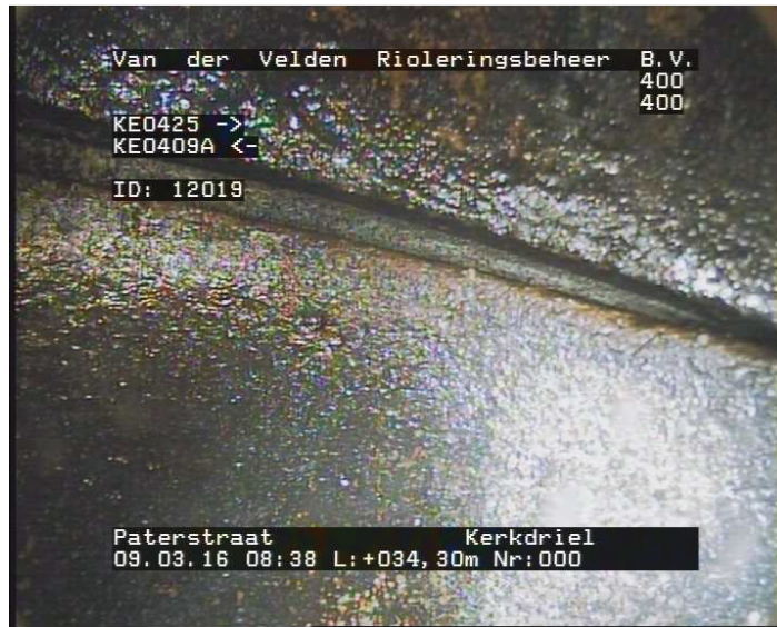
34.30 m1 Foto 030948112: Verplaatste verbinding Hoekverdraaiing