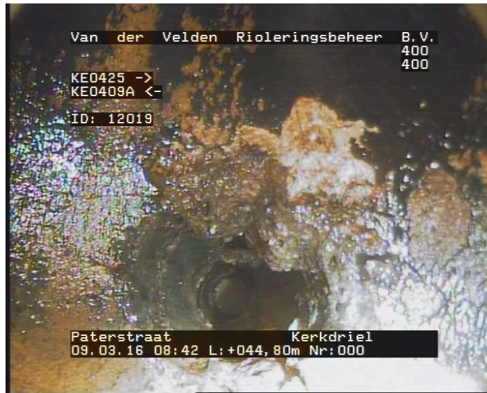
44.80 m1 Foto 030948712: Infiltratie Doorzweten