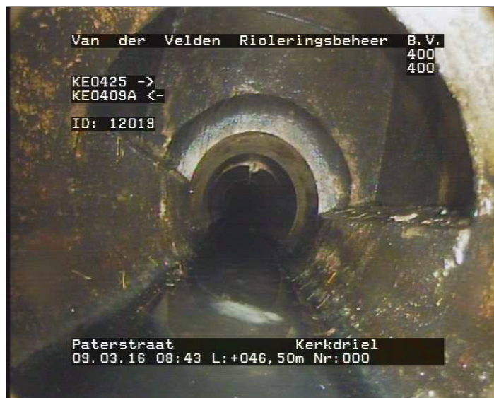
46.50 m1 Foto 030948912: Algemene foto