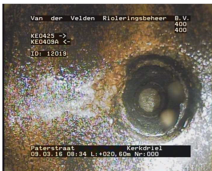
20.60 m1 Foto 030947412: Infiltratie Doorzweten