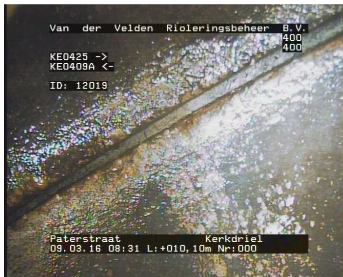
10.10 m1 Foto 030947012: Verplaatste verbinding Hoekverdraaiing