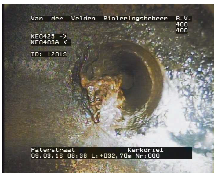
32.70 m1 Foto 030948012: Infiltratie Doorzweten