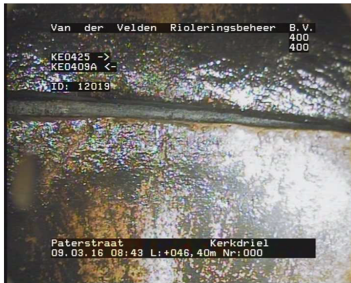
46.40 m1 Foto 030948812: Verplaatste verbinding Hoekverdraaiing