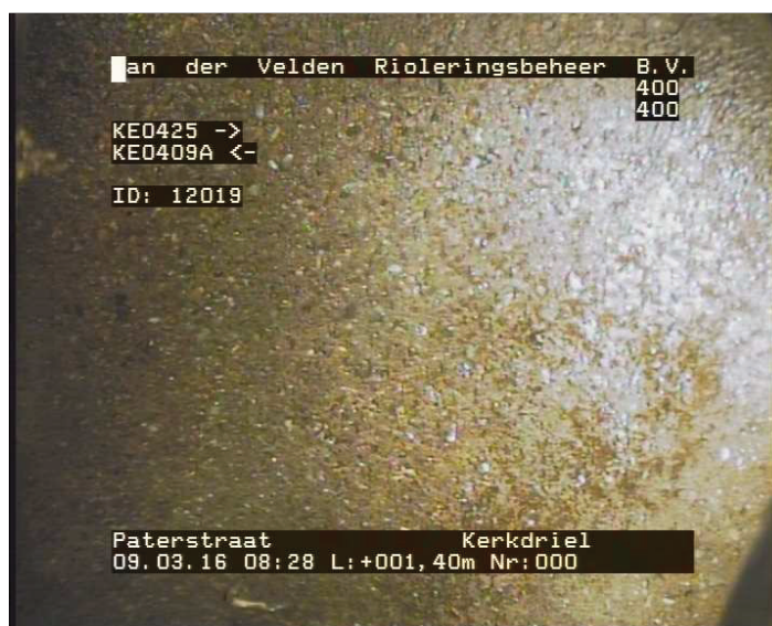
1.40 m1 Foto 030946412: Schade aan het oppervlak Afbrokkelen / zichtbare (kiezel)toeslagstof