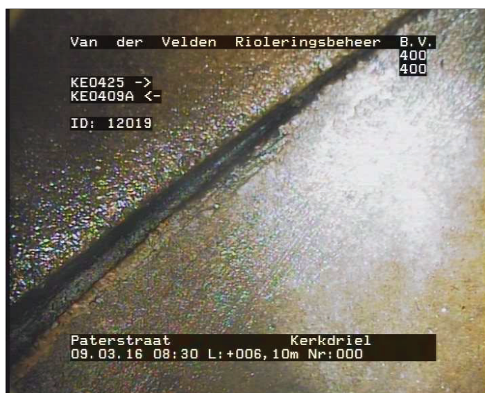
6.10 m1 Foto 030946812: Verplaatste verbinding Hoekverdraaiing