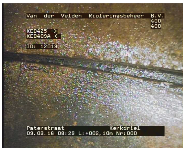
2.10 m1 Foto 030946512: Verplaatste verbinding Hoekverdraaiing