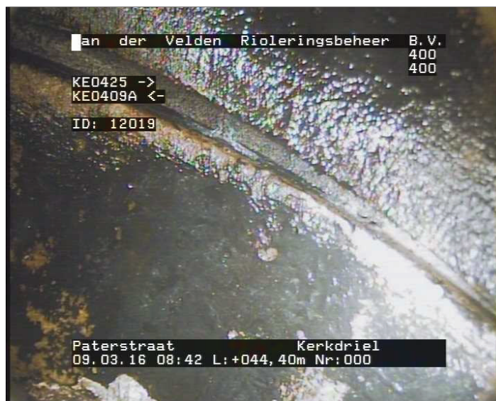
44.40 m1 Foto 030948612: Verplaatste verbinding Hoekverdraaiing