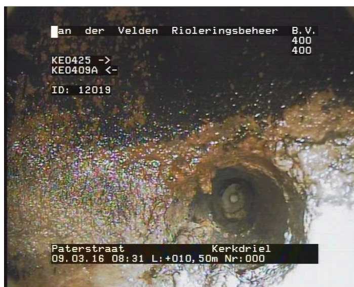
10.50 m1 Foto 030947112: Infiltratie Doorzweten