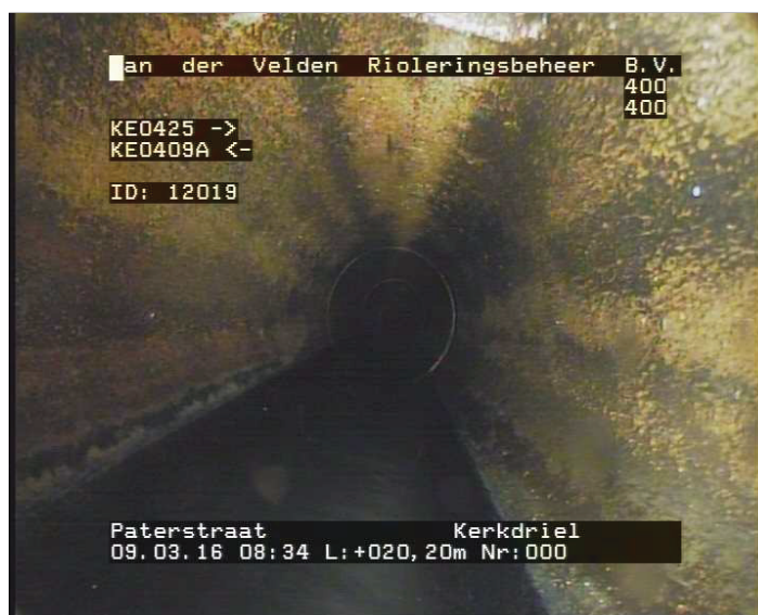
20.20 m1 Foto 030947312: Algemene foto