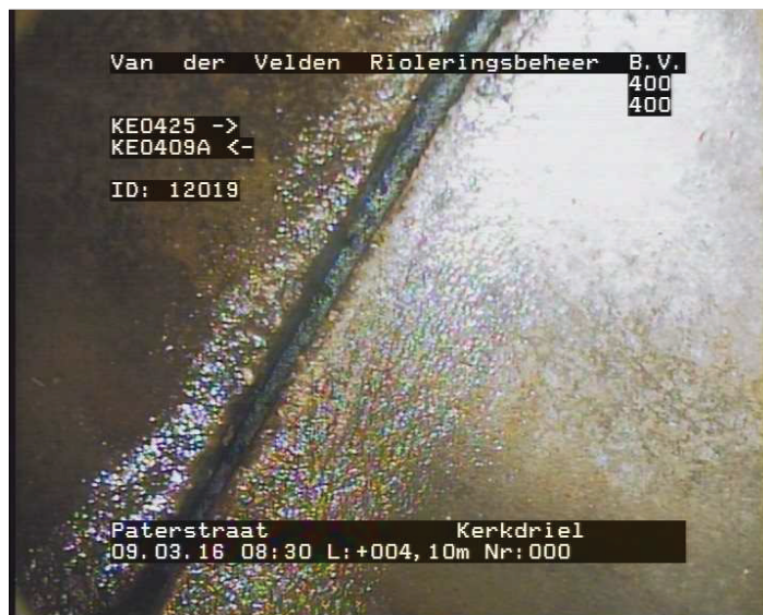
4.10 m1 Foto 030946712: Verplaatste verbinding Hoekverdraaiing