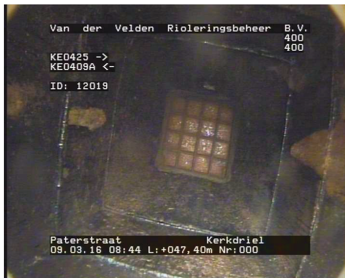
47.40 m1 Foto 030949012: Eindknoop Rioolput KE0409A