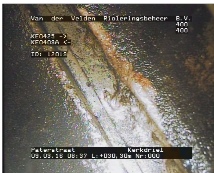
30.30 m1 Foto 030947912: Infiltratie Doorzweten