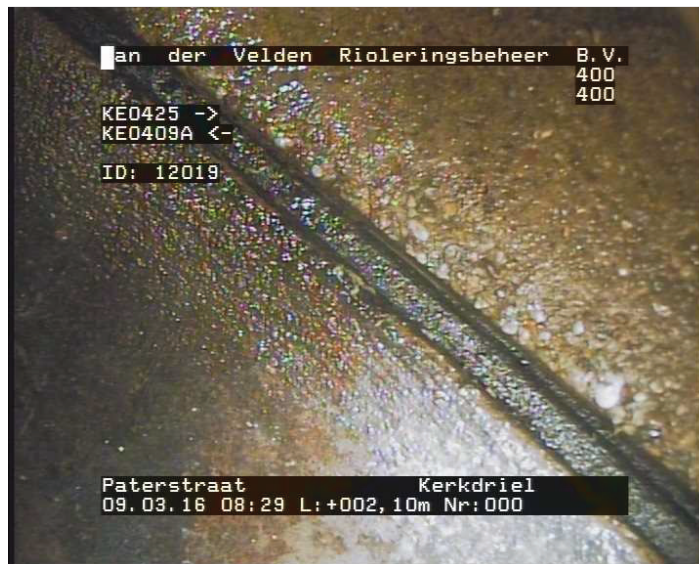
2.10 m1 Foto 030946612: Infiltratie Doorzweten