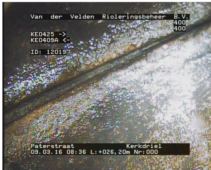
26.20 m1 Foto 030947612: Verplaatste verbinding Hoekverdraaiing