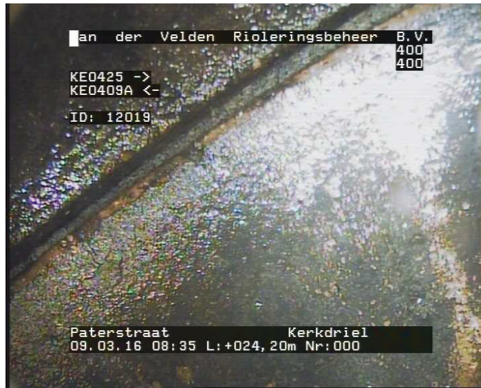
24.20 m1 Foto 030947512: Verplaatste verbinding Hoekverdraaiing