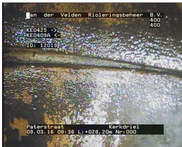
28.20 m1 Foto 030947712: Verplaatste verbinding Hoekverdraaiing