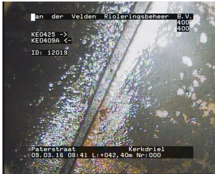
42.40 m1 Foto 030948412: Verplaatste verbinding Hoekverdraaiing