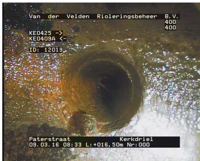
16.50 m1 Foto 030947212: Infiltratie Druppelend