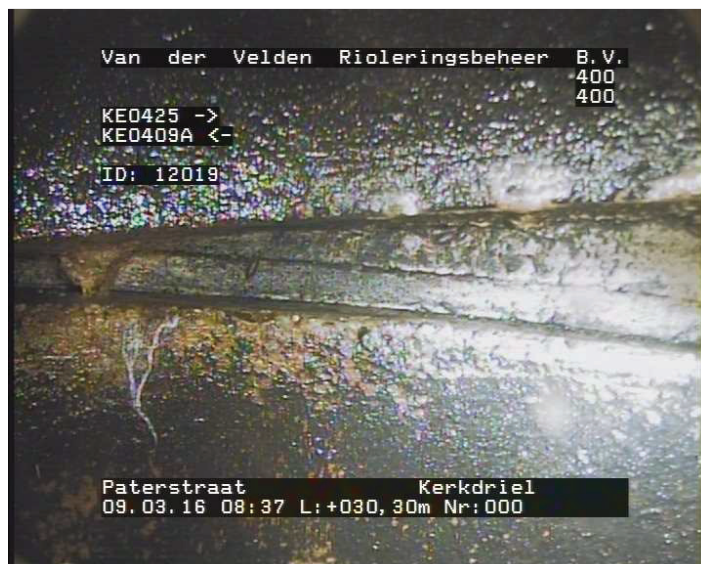
30.30 m1 Foto 030947812: Verplaatste verbinding Hoekverdraaiing