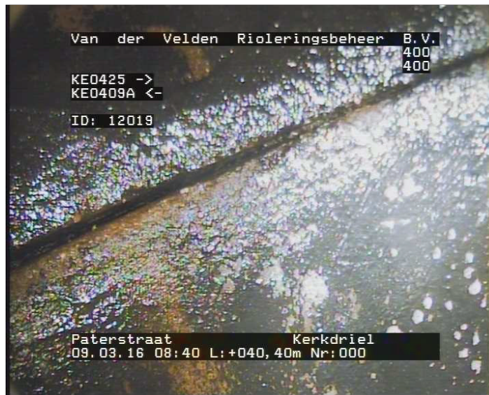
40.40 m1 Foto 030948212: Verplaatste verbinding Hoekverdraaiing