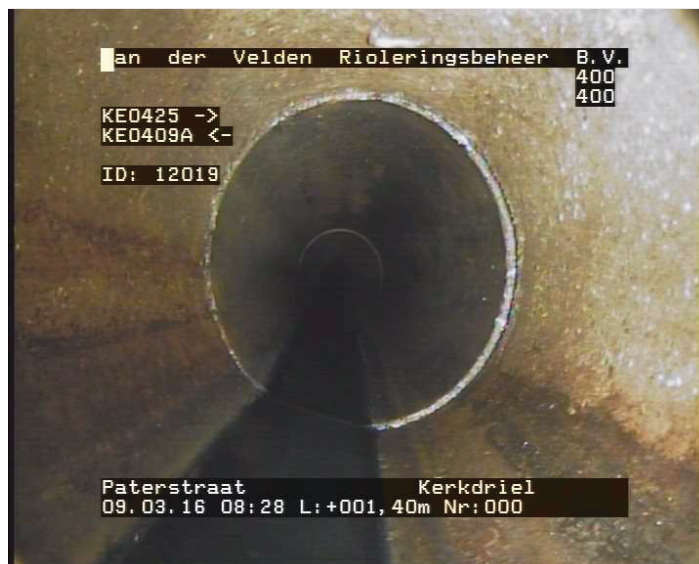
1.40 m1 Foto 030946312: Algemene foto