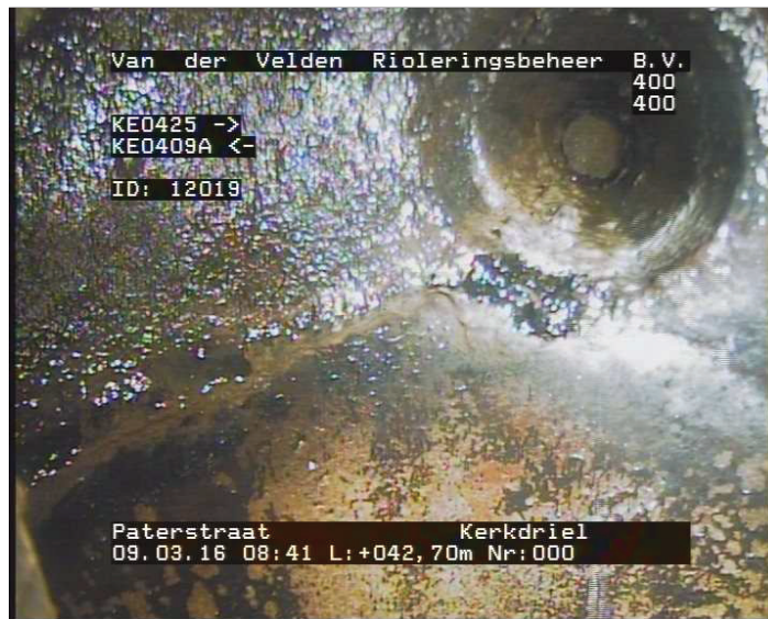
42.70 m1 Foto 030948512: Infiltratie Doorzweten