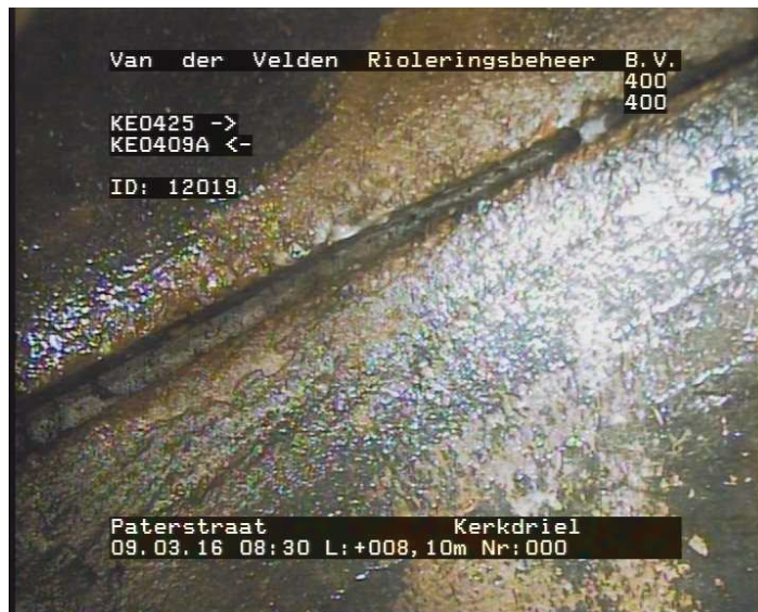
8.10 m1 Foto 030946912: Verplaatste verbinding Hoekverdraaiing