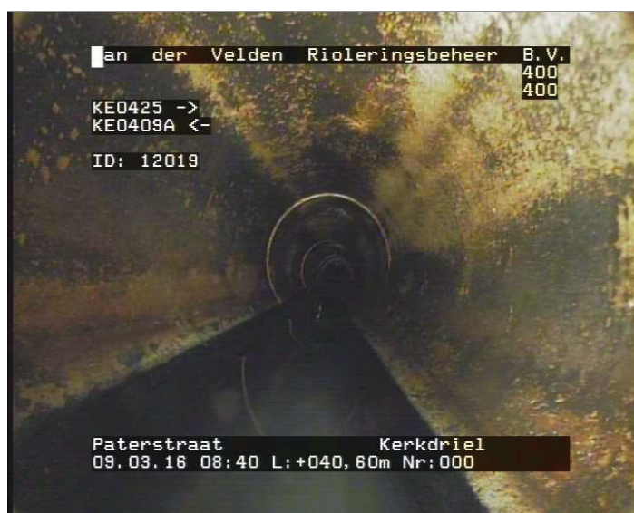
40.60 m1 Foto 030948312: Algemene foto